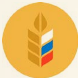
Министерство сельского хозяйства