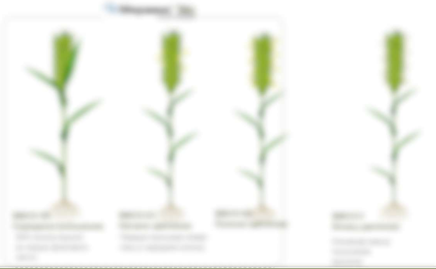
Схема применения МИРАВИС® Эйс на зерновых культурах 1. Подготовка почвы и посев семян. 2. Применение МИРАВИС® Эйс в фазе всходов. 3. Применение МИРАВИС® Эйс в фазе колошения. 4. Применение МИРАВИС® Эйс в фазе молочной спелости. 5. Применение МИРАВИС® Эйс в фазе созревания. 6. Применение МИРАВИС® Эйс в фазе уборки.