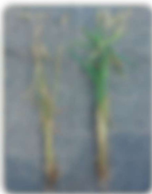
Контроль фузариоза колоса