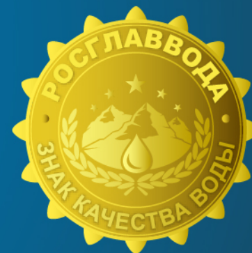
«ЗНАК КАЧЕСТВА ВОДЫ»