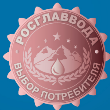
«Выбор потребителя» Бронза