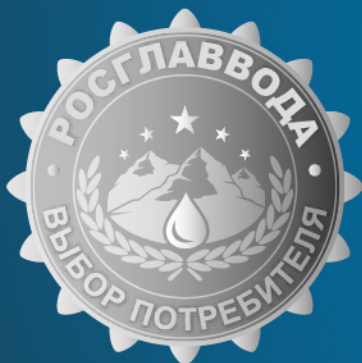
«Выбор потребителя» Серебро