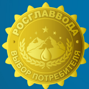
«Выбор потребителя» Золото