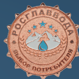
«Выбор потребителя» Бронза