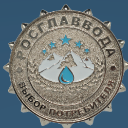
«Выбор потребителя» Серебро