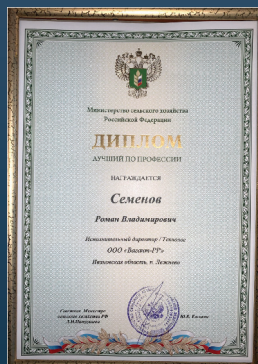
«Лучший по профессии»