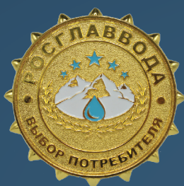
«Выбор потребителя» Золото