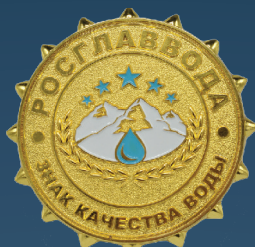
«ЗНАК КАЧЕСТВА ВОДЫ»